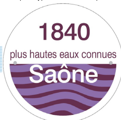
Pictogramme réglementaire (arrêté du 16 mars 2006)

montant de 4 500 € TTC, avec la participation financière de l'Etat, de la Ville de Mâcon, ainsi que des collectivités partenaires du Contrat de Vallée Inondable et du Programme d'Actions de Prévention des Inondations de la Saône.