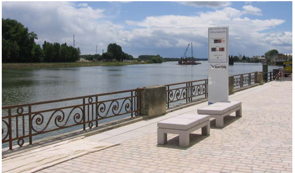
Le totem avec affichage digital dans son environnement (esplanade Lamartine à Mâcon)

Le dispositif comporte plusieurs affichages « haute luminosité » et peut être relié soit à un capteur de niveau d'eau indépendant, soit (comme à Mâcon) à un serveur informatique récupérant régulièrement les données du site internet national « Vigicrues » de la station la plus proche, mises à jour toutes les heures. Une convention a ainsi été passée avec le Service de Prévision des Crues du secteur Rhône Amont Saône (Délégation de Bassin de la DIREN Rhône-Alpes).