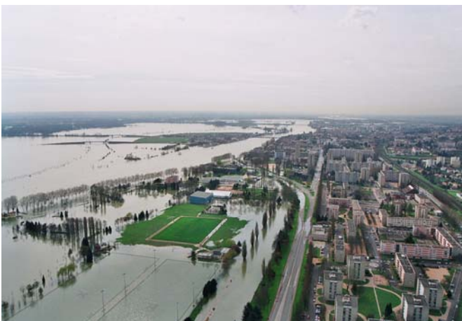
Mâcon et Saint-Laurent-sur-Saône