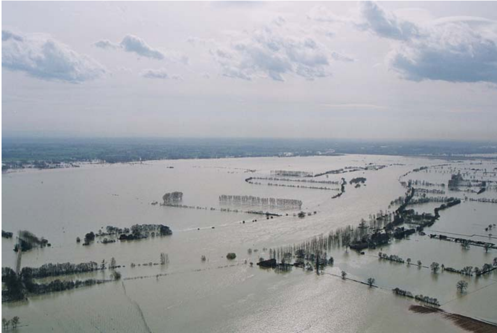
Le champs d'inondation de la Saône près du Pont d'Uchizy (71)

Les principales conséquences de la crue de mars 2001 se sont ressenties sur les activités économiques du bassin d'emploi de Chalon à Lyon. Des moyens techniques importants ont par ailleurs permis d'enregistrer les caractéristiques physiques de ce phénomène, qui sera utilisé comme référence dans les études et travaux des années ultérieures.