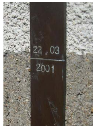
Repère de crue à Tournus (71)