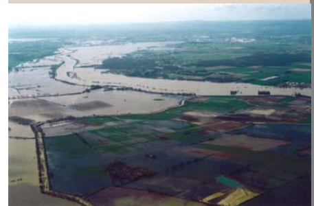
Les digues de Verjux à Alleriot (71)

Les digues agricoles du secteur de Verdun, Verjux, Saint-Maurice-en-Rivière, Bey, Damerey et Alleriot, n'ont pas été submergées. Plusieurs villages ainsi que près de 3 000 hectares de zones agricoles sont ainsi hors d'eau. La remontée naturelle de la nappe dans les terrains, l'eau de ruissellement et le débordement du ruisseau des Cosnes d'Epinossous créent cependant quelques submersions.