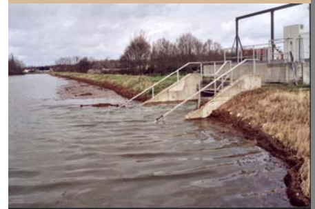
La digue d'Ouroux-sur-Saône (71)

Les villages de Saint Marcel, Lux et Ouroux-sur-Saône, en Saône et Loire, ont bénéficié de la protection de digues rapprochées des lieux habités qui avaient été construites dans les années 90. Plusieurs dizaines d'habitations ont ainsi été épargnées.