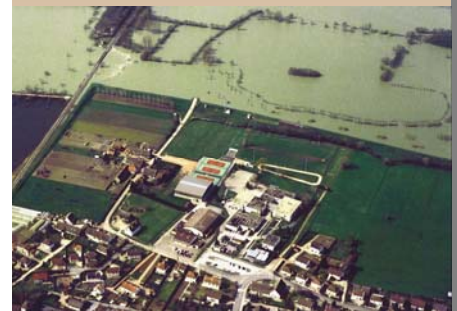
La digue de Saint Marcel (71)

Les digues agricoles du secteur de Verdun, Verjux, Saint-Maurice-en-Rivière, Bey, Damerey et Alleriot, n'ont pas été submergées. Plusieurs villages ainsi que près de 3 000 hectares de zones agricoles sont ainsi hors d'eau. La remontée naturelle de la nappe dans les terrains, l'eau de ruissellement et le débordement du ruisseau des Cosnes d'Epinossous créent cependant quelques submersions.